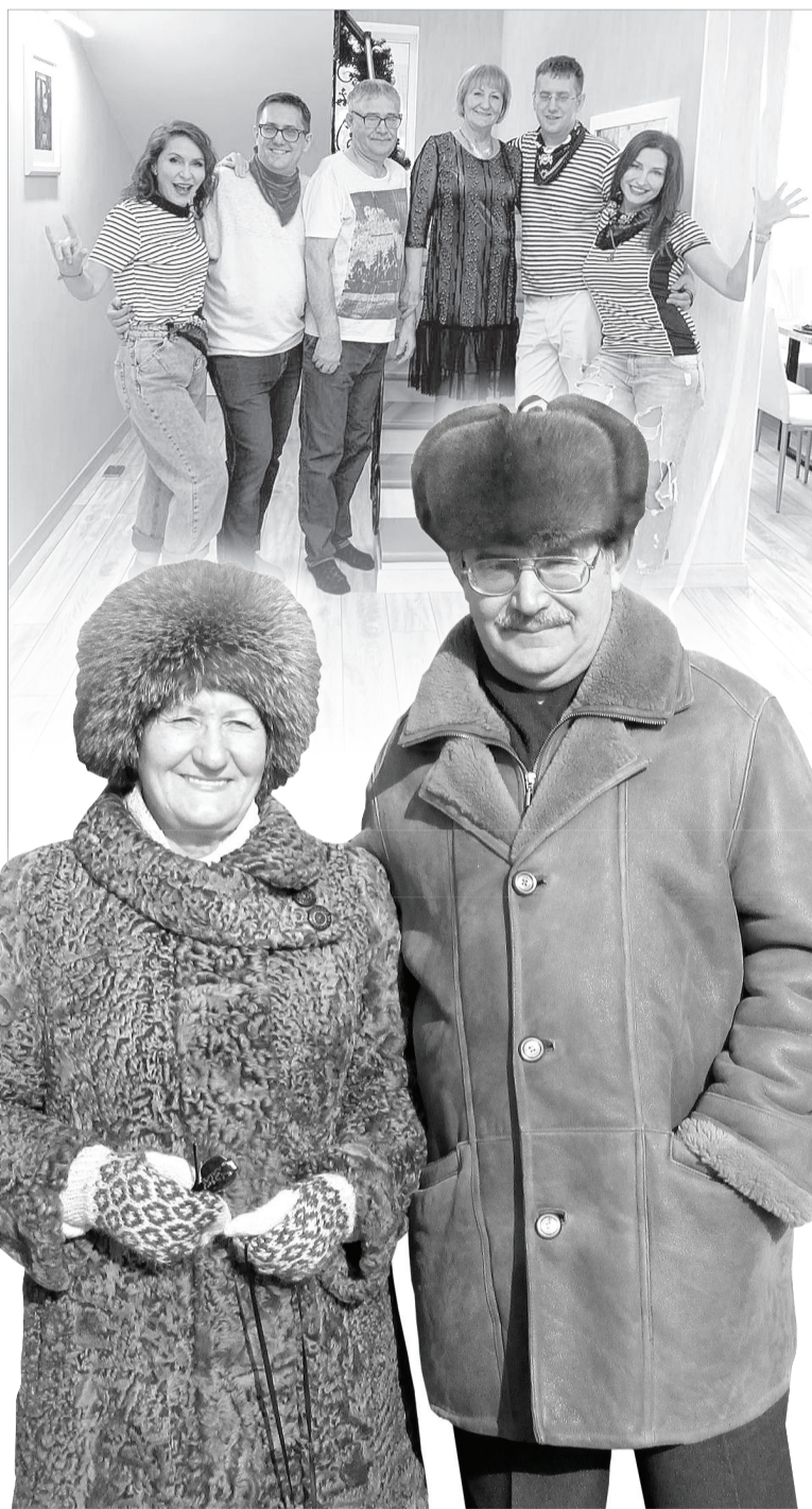
«Президент Владимир Путин о семье: