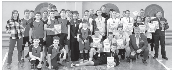
Команда Межениновской школы – победитель турнира